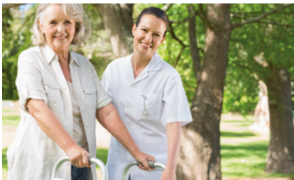
Absicherung des Pflegerisikos unter Berücksichtigung von Einmalprämien-Konzepten