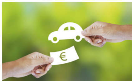
KFZ-Versicherung: Telematik-Tarife kommen auf den Markt