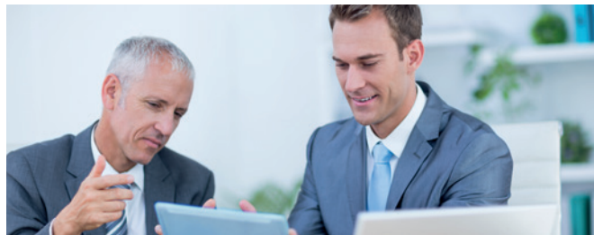
Aktuelles aus der betrieblichen Altersversorgung (bAV)