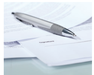
Die Versicherbarkeit von Produktausfall- und Rückrufregressrisiken