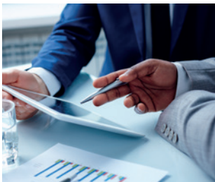
Höchstentschädigungen in der industriellen und großgewerblichen Sachversicherung