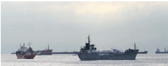
Der Konkurs der Hanjin Shipping Co., Ltd.