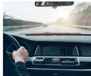
Mobilitätsgarantie bei Schutzbriefen